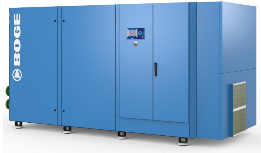
Version refroidissement par eau Jusqu'à 355kw SO_ (F)W