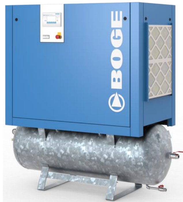
Version sur réservoir Avec sécheur C_-2(LF)DR