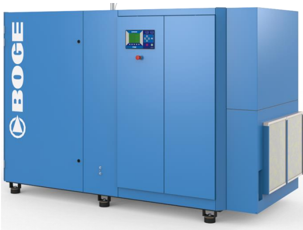
Version refroidissement par air Jusqu'à 90kw SO_ (F)A

La gamme SO_ la gamme non lubrifié de 45 à 355kw Refroidissement par air ou eau et version fixe ou variable