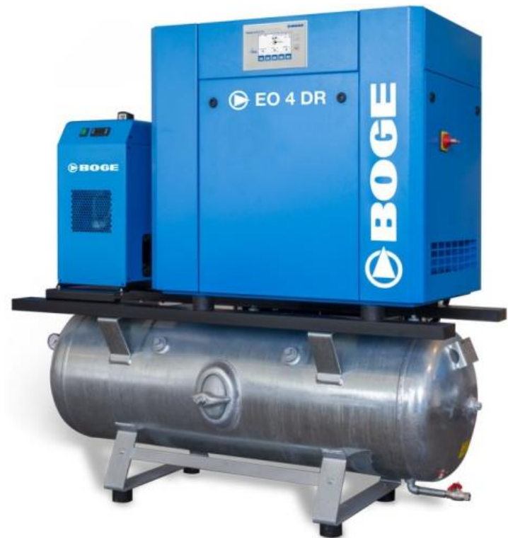
Version sur réservoir avec sécheur