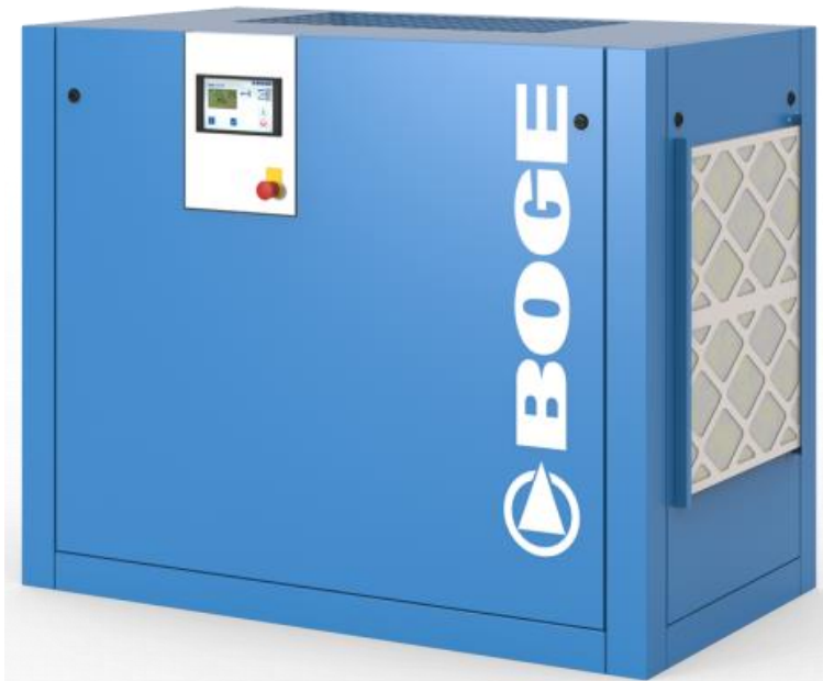
Version standard C_-2(LF)R

La gamme C_2 Version performance en poulie/courroie ou entrainement direct de 11 à 22kw vitesse fixe et variable