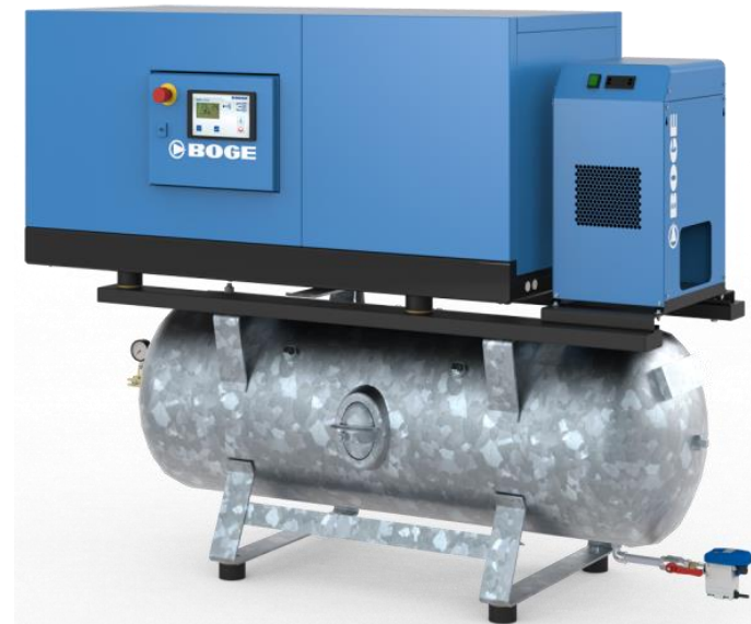
Version super insonorisation