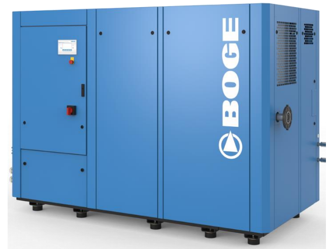
Version avec sécheur jusqu'au 110kw S_ 4(L)(F)D