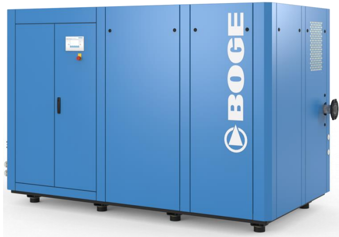
Version compresseur seul disponible en entraînement par engrenage sur vitesse fixe S_ 4(L)(F)

La gamme S_ - 4 Version de 45 à 160kw version haute performance entraînement direct ou poulie courroie et vitesse fixe ou variable